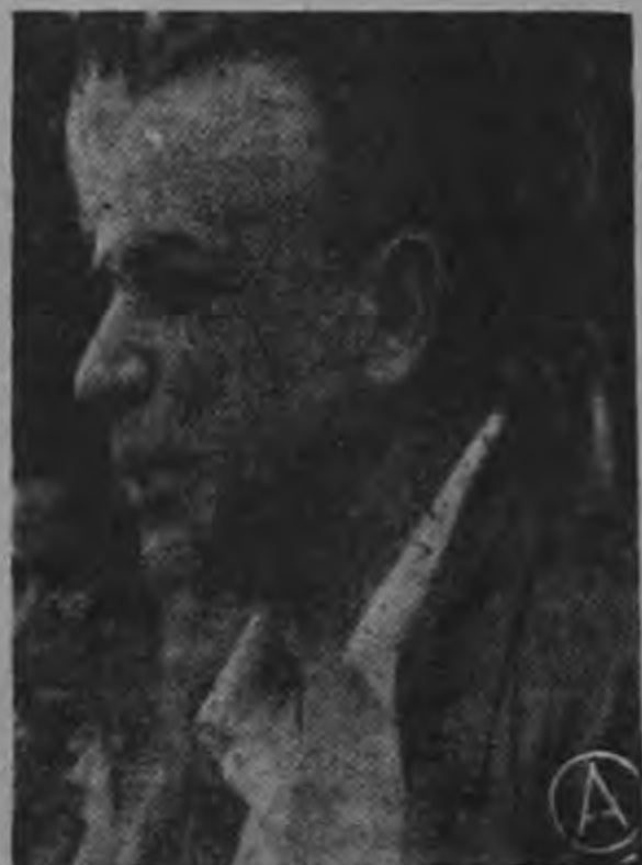
Don Francisco J. Orlich